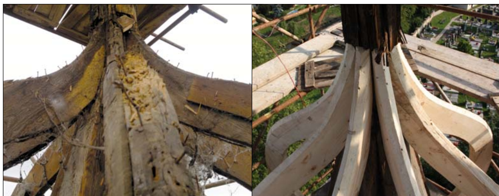
Ukázka poškození ramenátů sanktusové věžičky

Robert Kopp Arcibiskupství pražské Stavební odbor