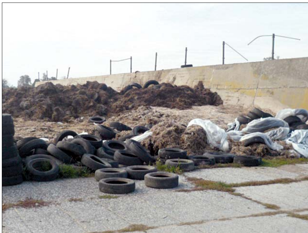
Pohled na místo budoucí kompostárny

nejedná pouze o drobná pochybení, ale dle výsledku červnové kontroly Oblastním inspektorem práce pro Středočeský kraj na OÚ Kostomlaty n. L., o velice závažná porušení pracovních vztahů, resp. porušení zákona. Za podobně závažné pochybení, minimálně v úrovni naprostého nezájmu o budoucnost obce, bych považoval možnost občanů se vyjádřit k plánovanému provozování kompostárny v katastru obce. Minimálně rok a půl bylo v obci veřejným tajemstvím, že jeden z podnikatelských subjektů chystá uskutečnit podnikatelský záměr v podobě provozu kompostárny. Minimálně rok a půl, v rámci veřejnosti přístupným zasedáním zastupitelstva obce,