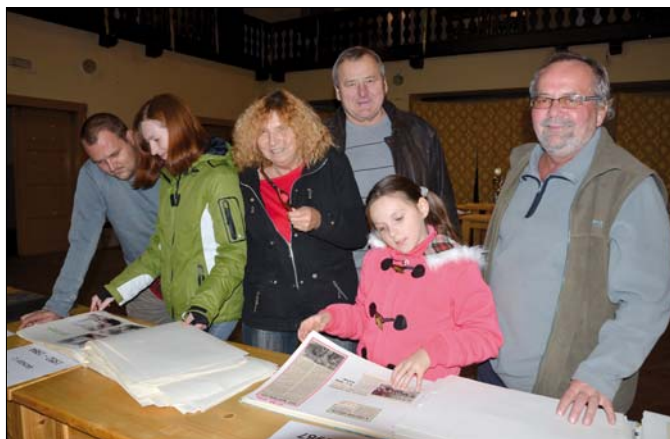
Občané Kostomlat si prohlížejí obecní kroniky