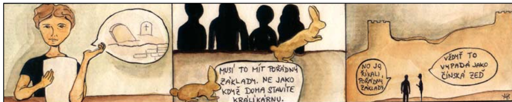
Hřbitovní zed' - Aneta Havelková

Čerpáno: Zápis ze 4. zasedání zastupitelstva obce Kostomlaty nad Labem, které se konalo 20. června 2013, Zápis ze 6. zasedání zastupitelstva obce Kostomlaty nad Labem, které se konalo 3. září 2013