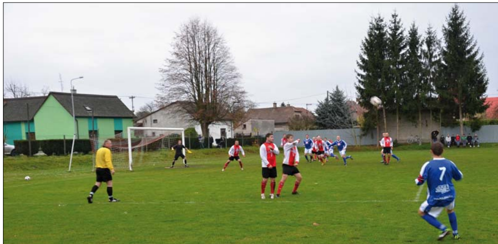
Derby Ostrá - Kostomlaty n. L. - 1:1